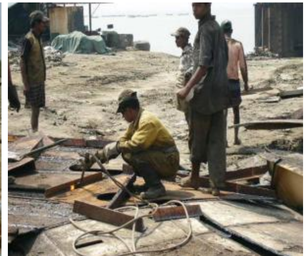
労働者に対する不十分な保護