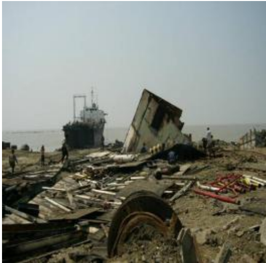
未整備の解体ヤード